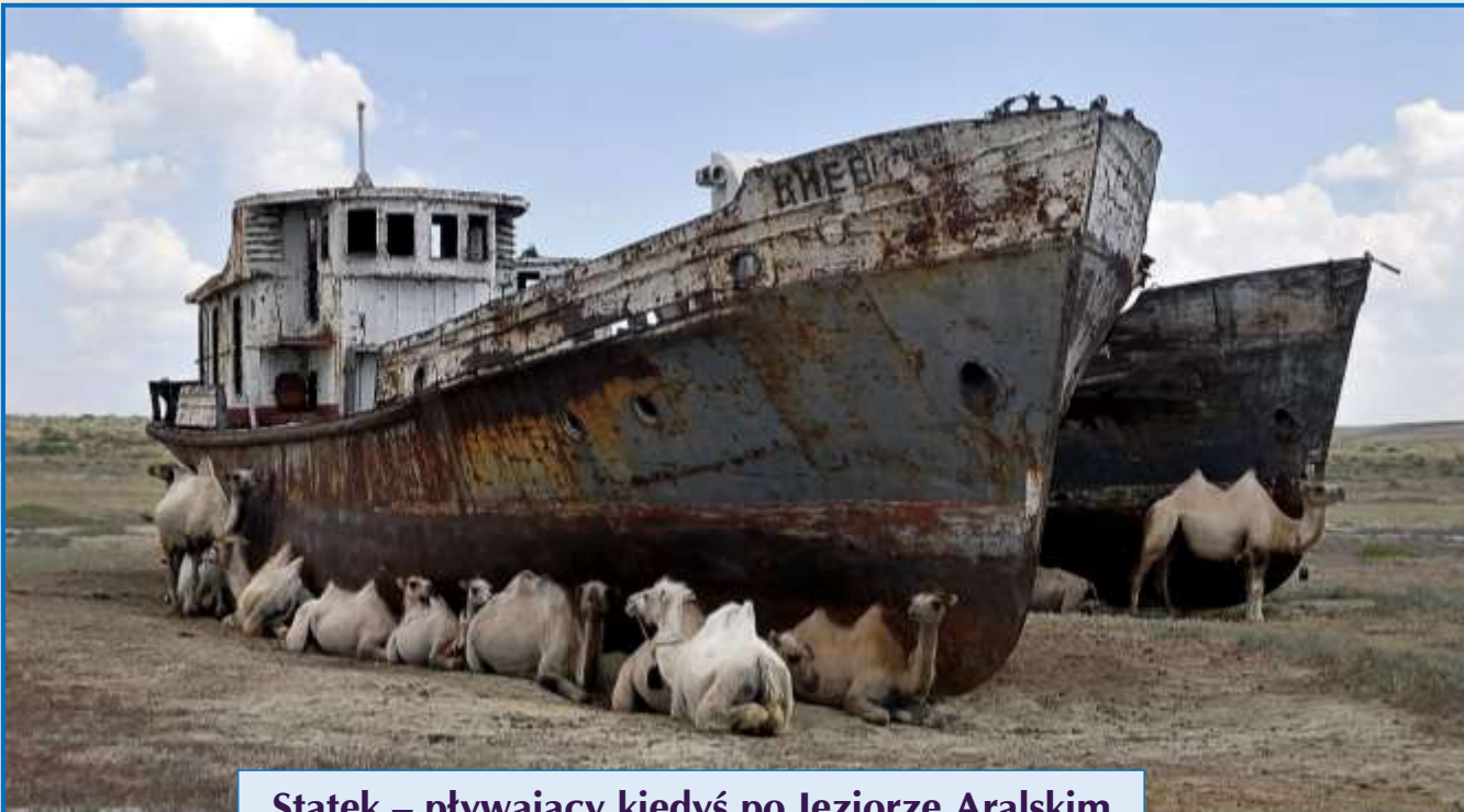
Statek – pływający kiedyś po Jeziorze Aralskim