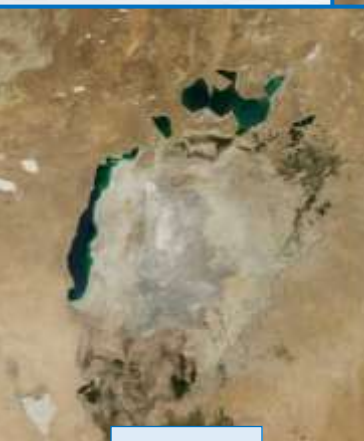
1973 – czwarte pod względem powierzchni jezioro na świecie