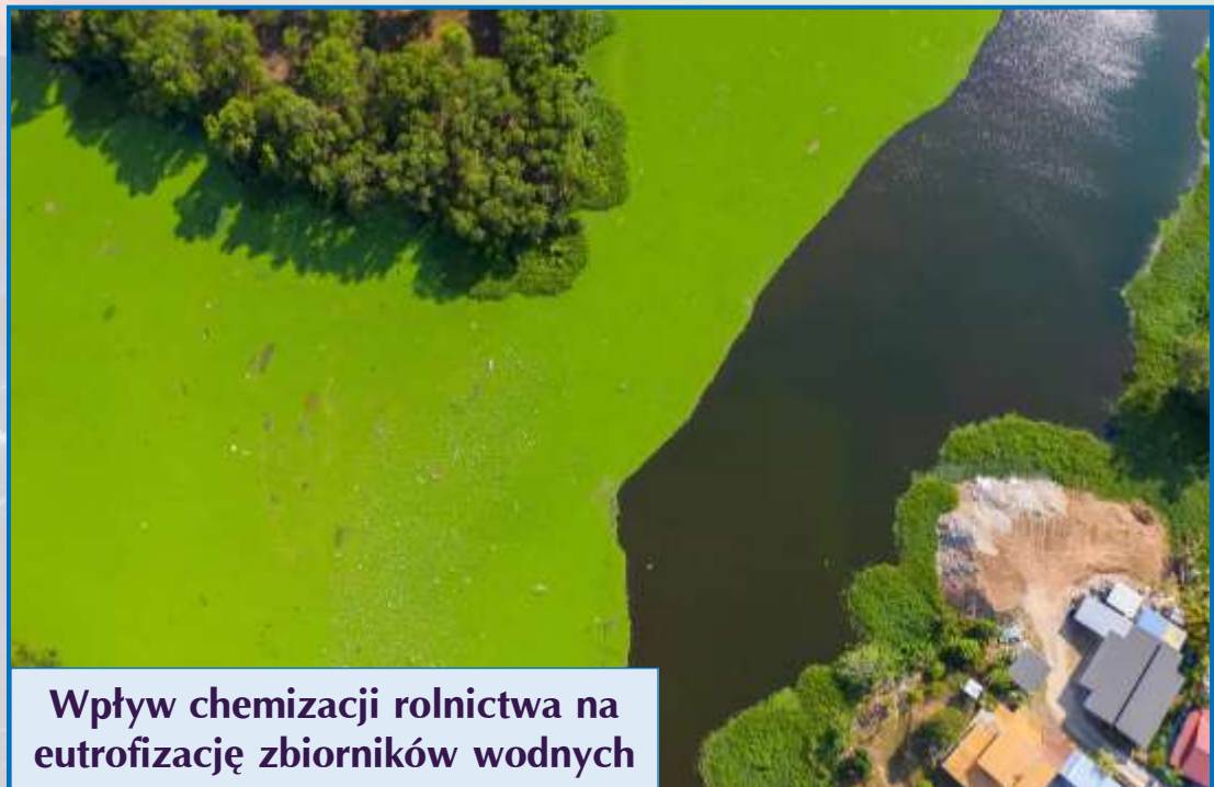
Wpływ chemizacji rolnictwa na eutrofizację zbiorników wodnych