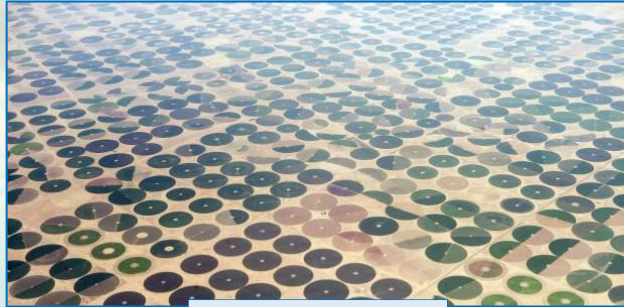
Pola sztucznie nawadniane