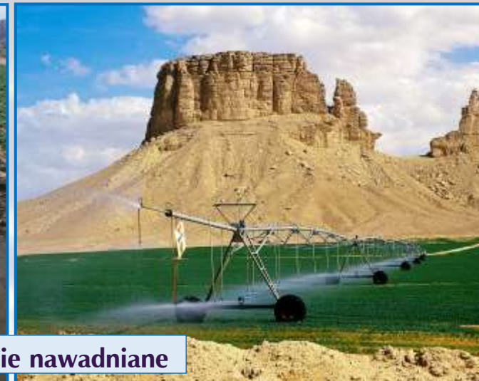
Pola sztucznie nawadniane