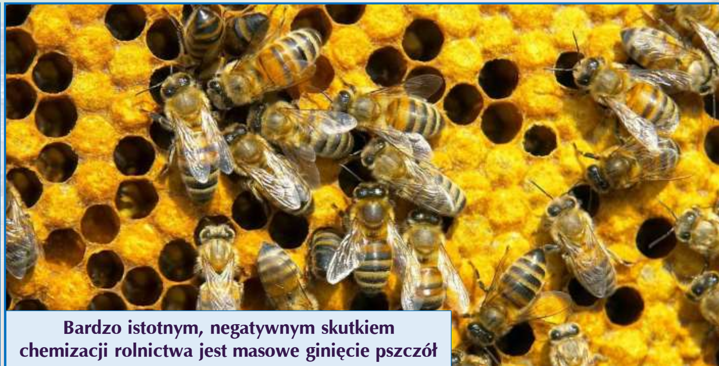
Bardzo istotnym, negatywnym skutkiem chemizacji rolnictwa jest masowe giniecie pszczół