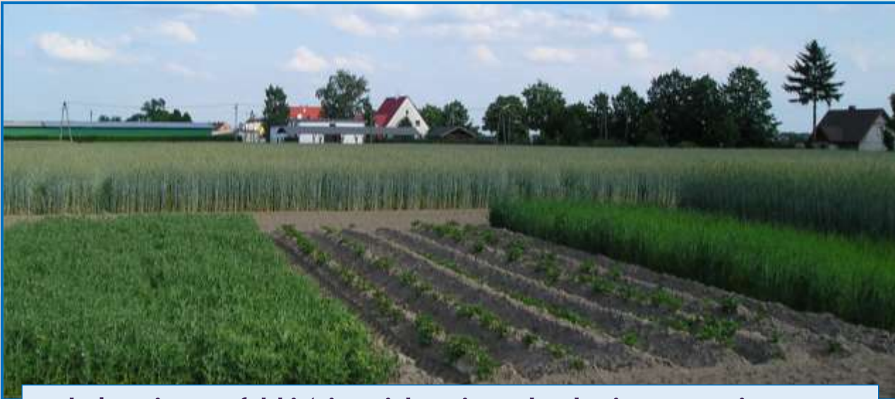
Płodozmian norfolki (ziemniak-owies-peluszka-żyto; “na pierwszym planie”) i 55-letnia monokultura żyta (“na drugim planie”) w Rolniczym Zakładzie Doświadczalnym Swojec Uniwersytetu Przyrodniczego we Wrocławiu