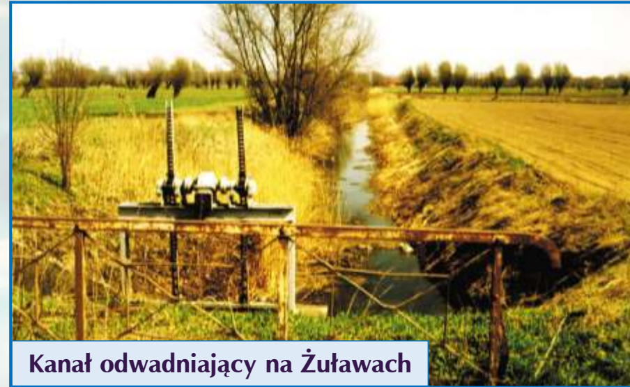
Kanał odwadniający na Żuławach