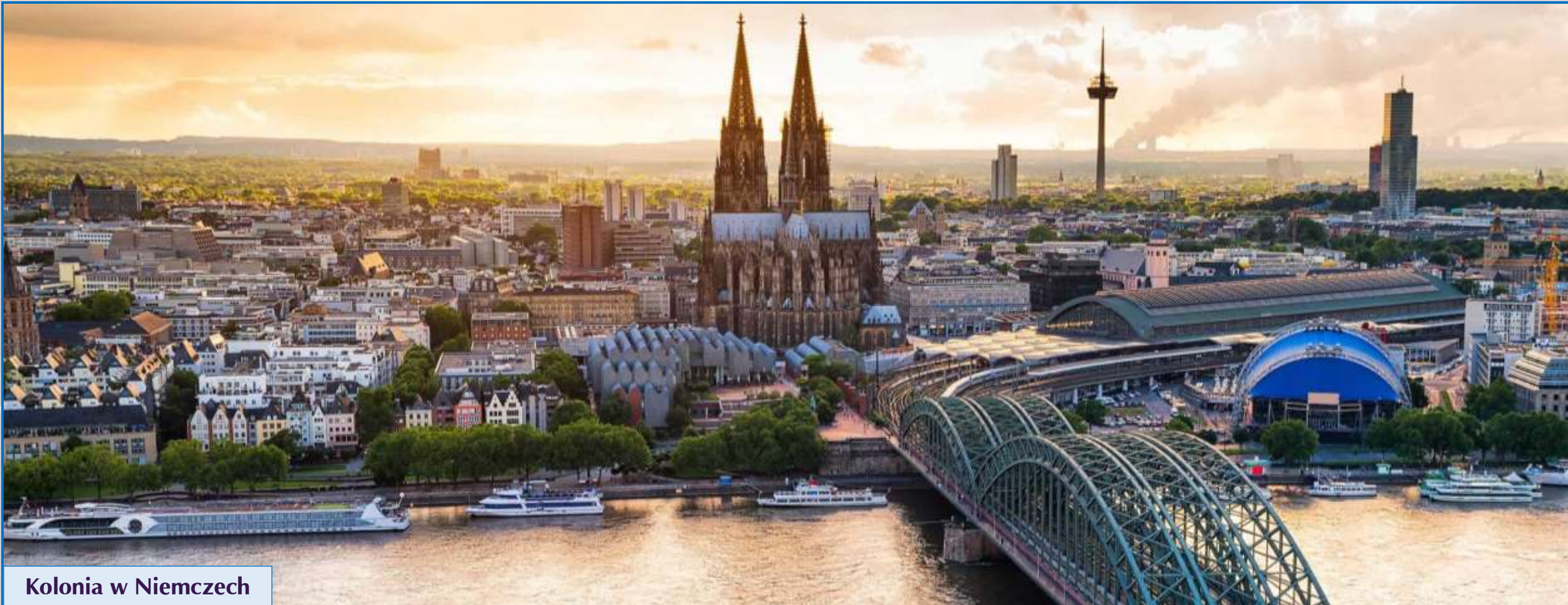
Kolonia w Niemczech