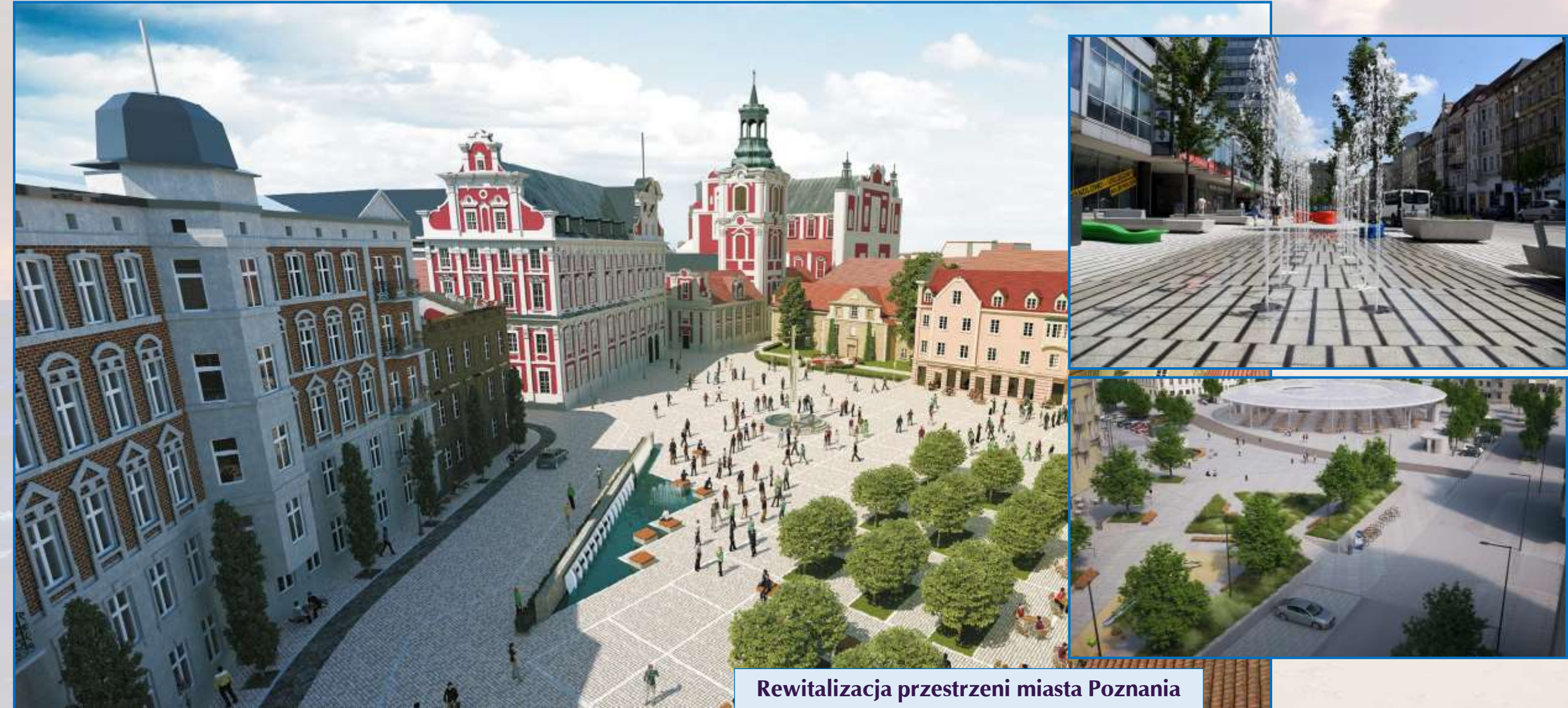
Rewitalizacja przestrzeni miasta Poznania