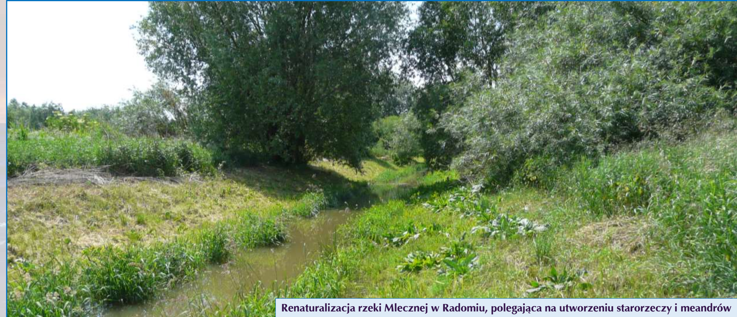
Renaturalizacja rzeki Mlecznej w Radomiu, polegająca na utworzeniu starorzeczy i meandrów