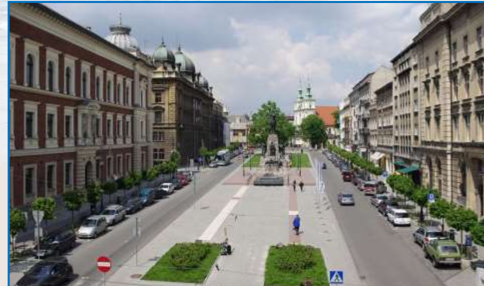
Rewitalizacja przestrzeni miasta Kraków