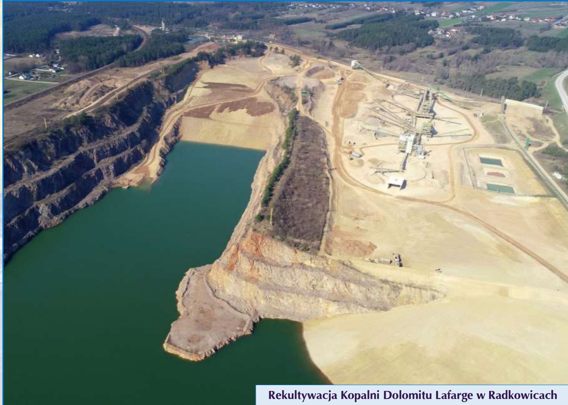
Rekultywacja Kopalni Dolomitu Lafarge w Radkowicach