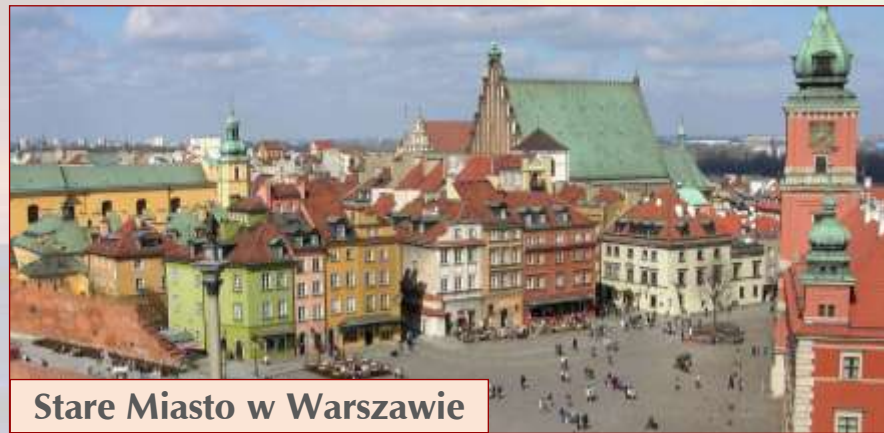
Stare Miasto w Warszawie